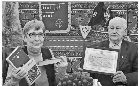
Казакъстан Президентының тәбрикләү хатын тапшыру вакытында Казандагы вәкилектә. 2021 ел.