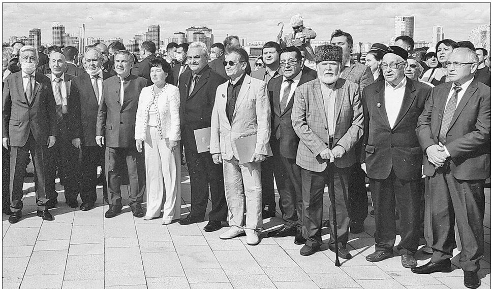
Лирон Хамидуллинга Габдулла Тукай премиясен тапшыру тантанасында. Лауреатны ТР Президенты Рәстәм Миңнеханов, ТР Дәүләт Киңәшчесе Минтимер Шәймиев, ТР Дәүләт Советы Рәисе Фәрит Мөхәммәтшин, каләмдәшләре котлады. 2020 ел.